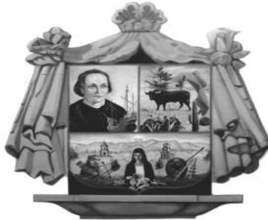
PRESIDENCIA MUNICIPAL COLÓN, QRO.